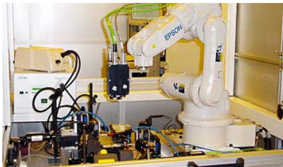
Halbautomatische Montagestation zur Fertigung hybrid-optischer Module

APplus stellt bei ASKION den führenden Datenpool dar. Firmenspezifische Abläufe wie z. B. Beantragung, Genehmigung, Abrechnung von Dienstreisen, das Thema Urlaub (Planung, Beantragung, Genehmigung etc.) oder der komplexe Vorgang der Bedarfsanmeldung von Dienstleistungen oder Kaufteilen werden ausschließlich über einen standardisierten Workflow papierlos abgewickelt. Dazu fungiert APplus als zentrale Stelle. Die erforderlichen Eingabemasken oder Übersichten wurden außerhalb des ERP-Systems programmiert. Die damit notwendigen oder erzeugten Daten werden aus APplus ausgelesen oder in die APplus-Datenbank eingespielt.